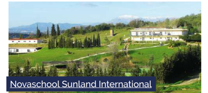
Novaschool Sunland International