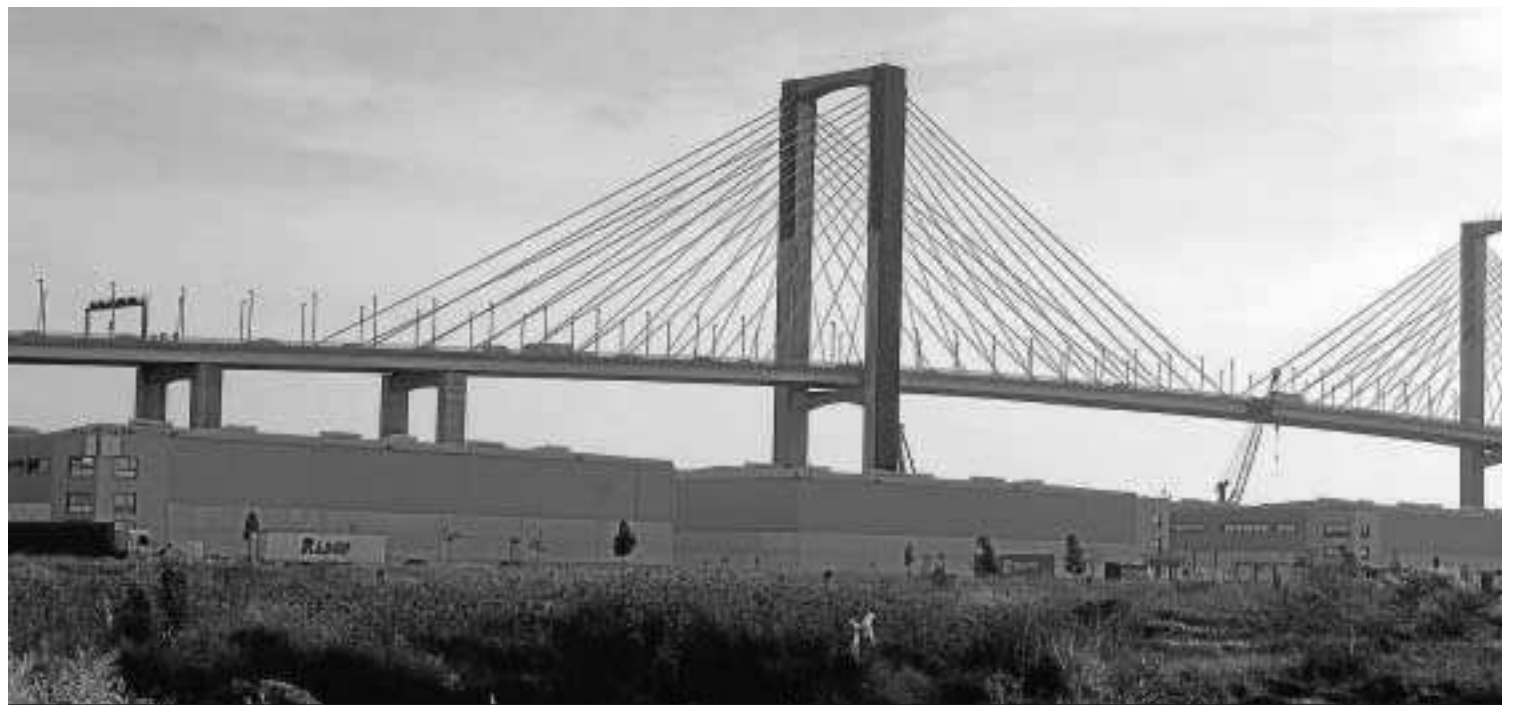
El puente del Centenario visto desde las instalaciones logísticas del Puerto de Sevilla.

Moral reitera que únicamente cuando se culmine esta carretera estratégica para Sevilla y su entorno es adecuado afrontar las reformas y ampliaciones del Puente del Centenario que se necesitan. “Lo primero es cerrar la SE-40 que está muy avanzada y cuando esta segunda ronda esté