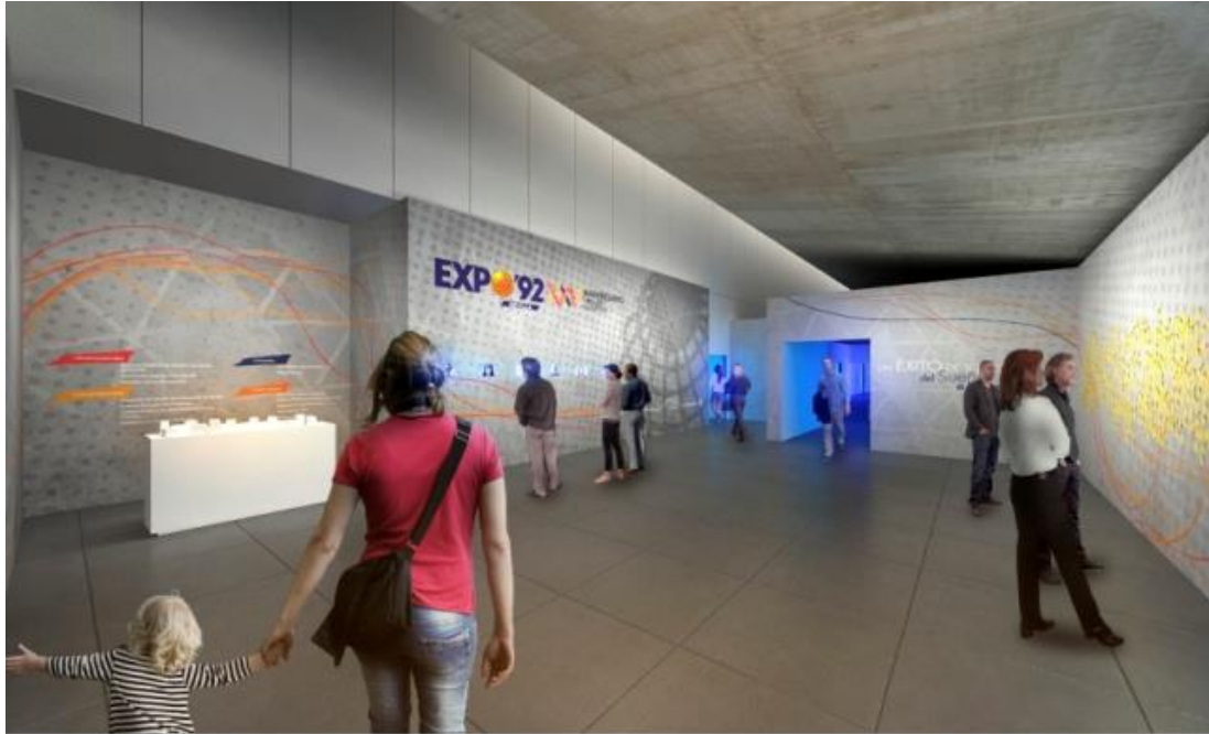
01 Vestíbulo Acceso, Recepción y Control