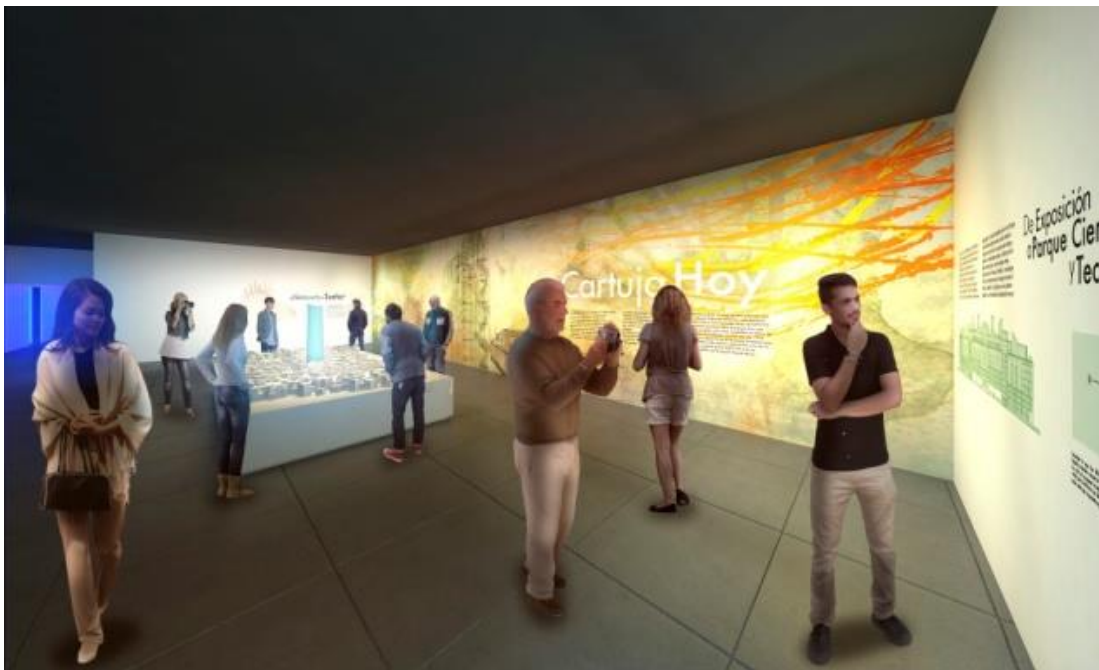
10 Bloque Temático C Una isla muy Viva