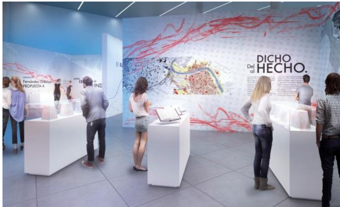
02 Bloque Temático A Palabras para un Sueño