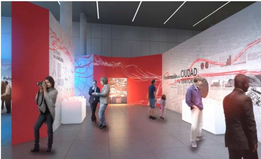
04 Bloque Temático A Transformar la Ciudad y el Territorio