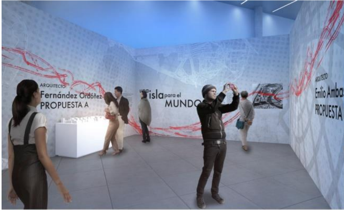
05 Bloque Temático A Una Isla para el Mundo