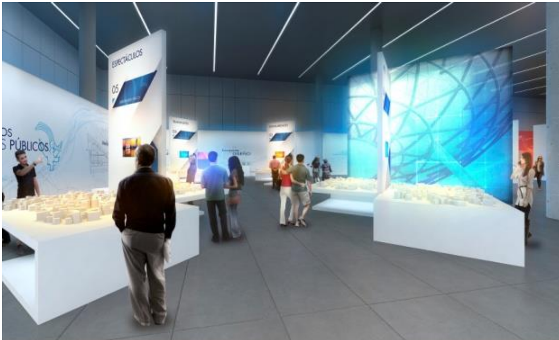
08 Bloque Temático B Arte y Cultura en EXPO'92