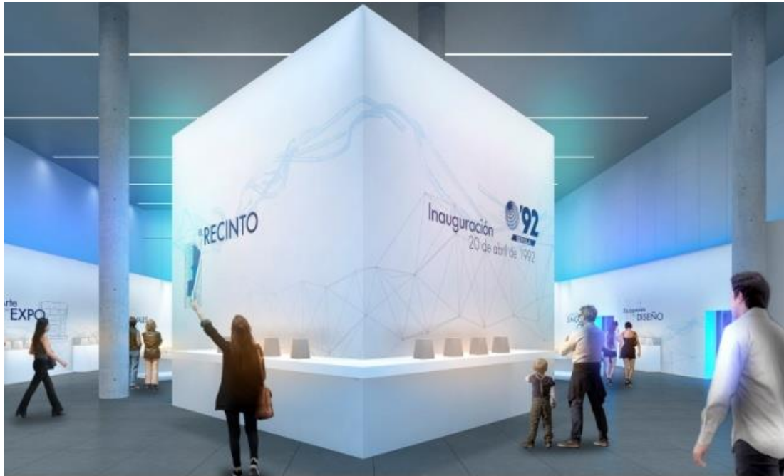
06 Bloque Temático B A la Hora Señalada: Inauguración