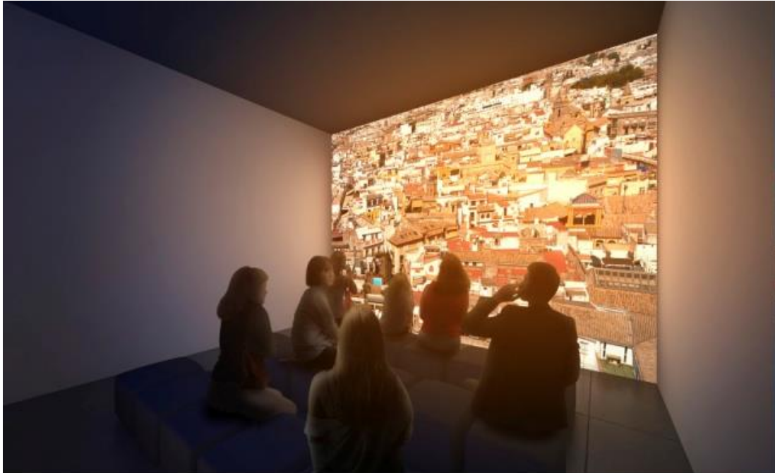
03 Bloque Temático A Sala de Proyección 1