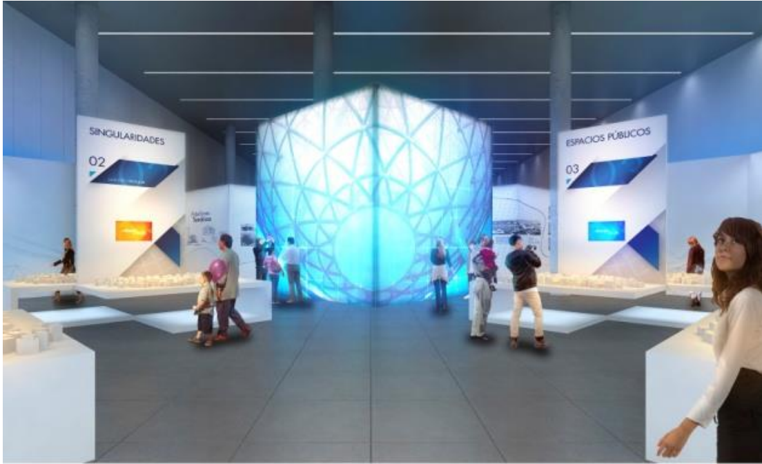
07 Bloque Temático B Espacios para el Encuentro